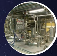
Elektro-, Mess-, Regelungs- technik