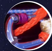
Health-Safety- Environment für normengerechte CE- Kennzeichnung