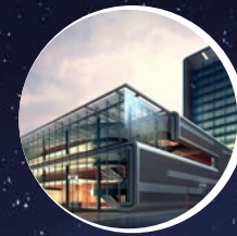
Technische Gebäude- ausrüstung