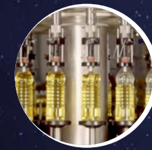
Maschinen- und Anlagenauto- matisierung